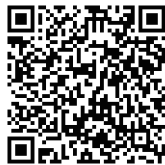
アンケートフォーム

【応募締切】 2022年9月30日(金) 当日消印有効 ※応募いただいた個人情報は、当社からのご案内 にのみご使用させていただきます。